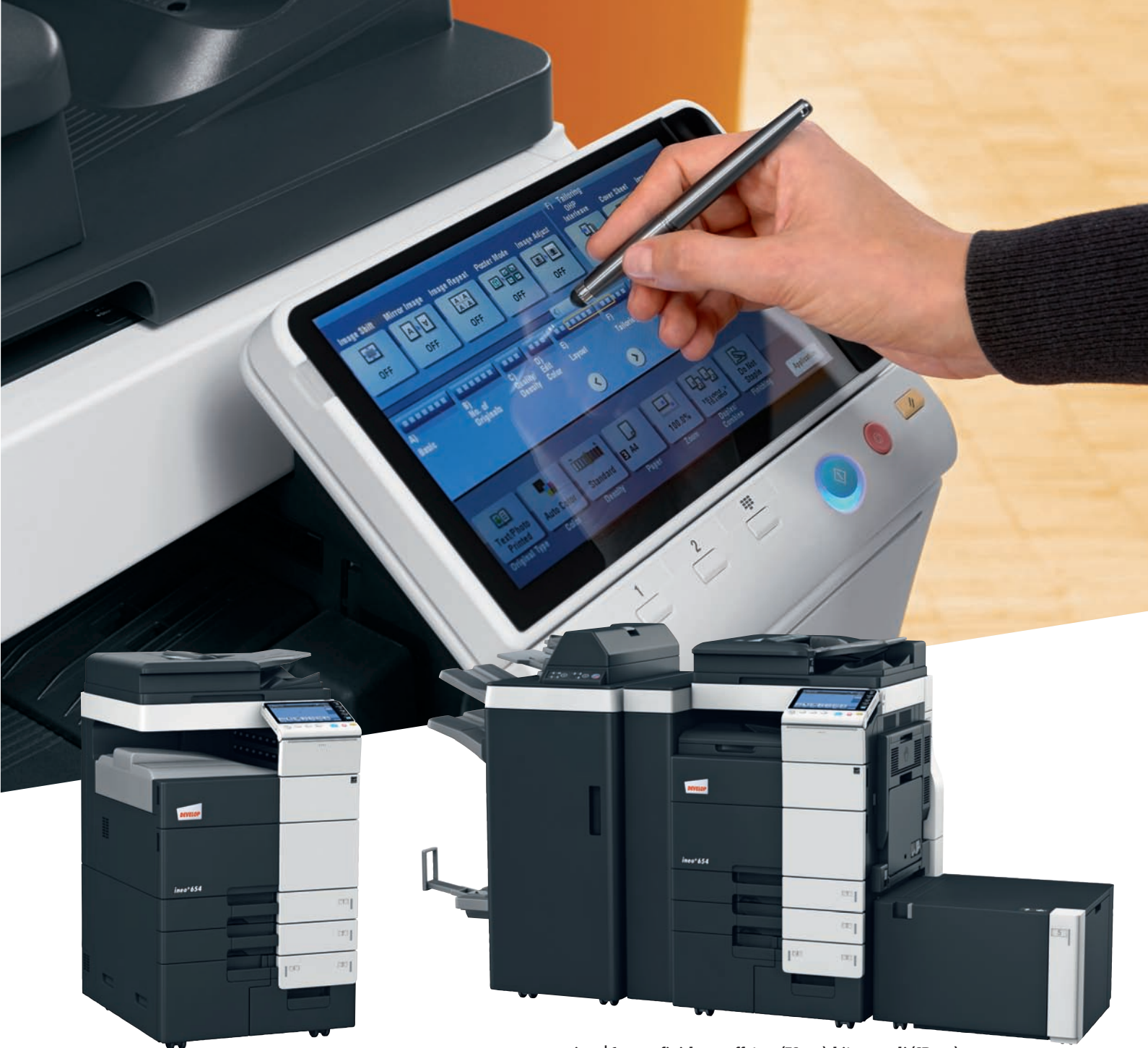
ineo+654 con vassoio uscita copie (OT-503)